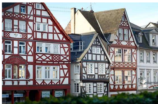
Colonia, casco antiguo

Importante: los exámenes tienen lugar si hay 3 estudiantes como mínimo.