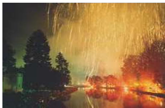
El Rin en llamas